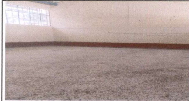
Foto 1: Sustitución de piso de torta de concreto por piso granito (aula 1)