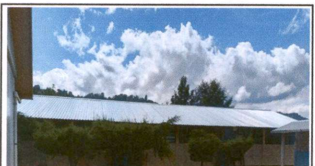
Foto 5: Sustitución de lámina por lámina troquelada aluzinc calibre 26 (modulo 2)